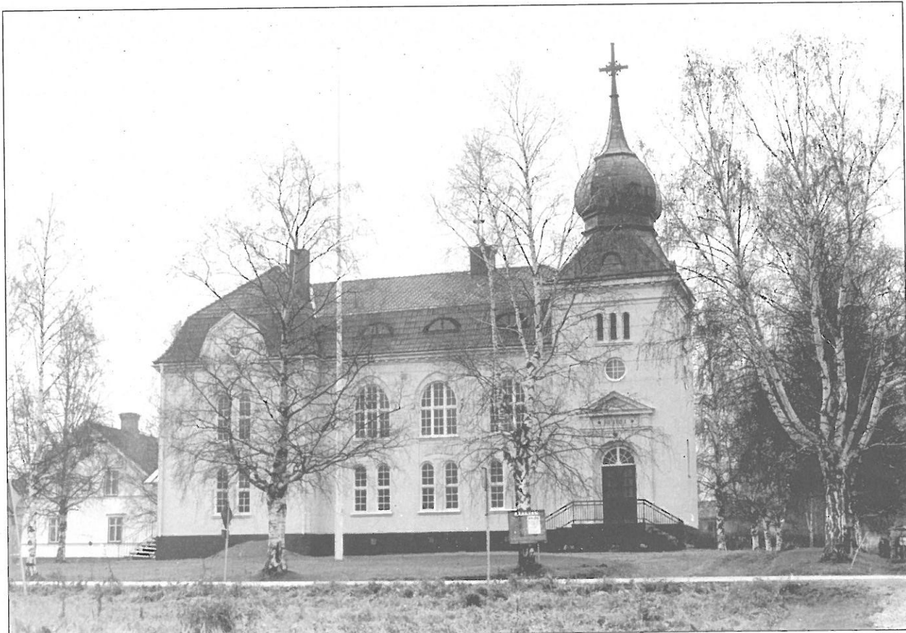
Frikyrka från norr.