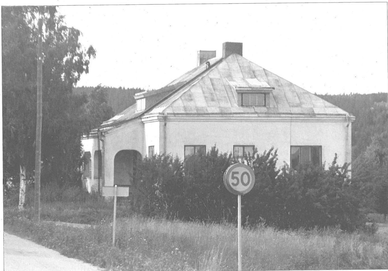
Byggnad norr om landsvägen.