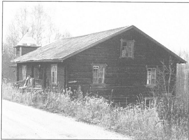
Kvarn-elverksbyggnad från sydväst.